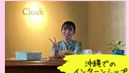
沖縄での インターンシップ